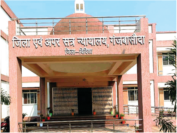
रूपये के अर्थदण्ड से दण्डित किया है। मामला इस प्रकार है कि दिनांक