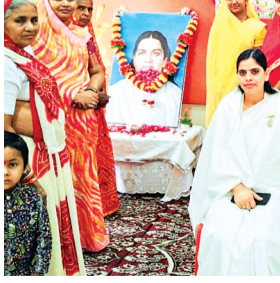
हरिभूमि न्यूज ►► गंजबासोदा