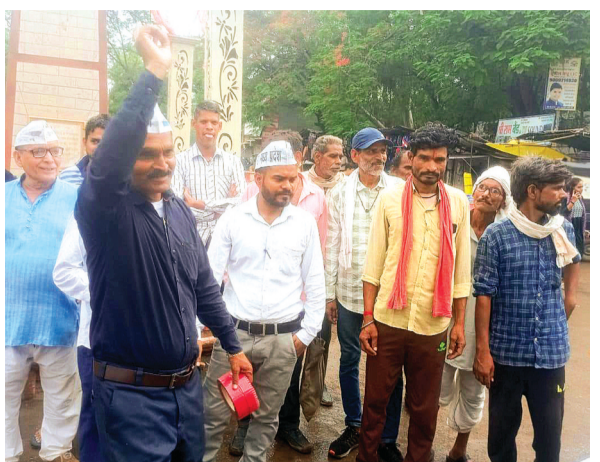
हरिभूमि न्यूज ►► गंजबासोदा