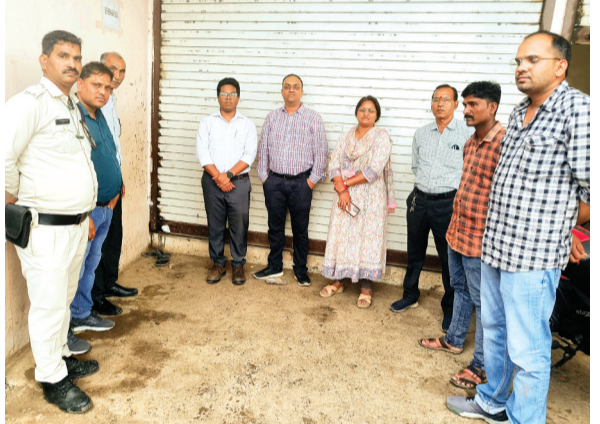
हरिभूमि न्यूज ►► गंजबासोदा