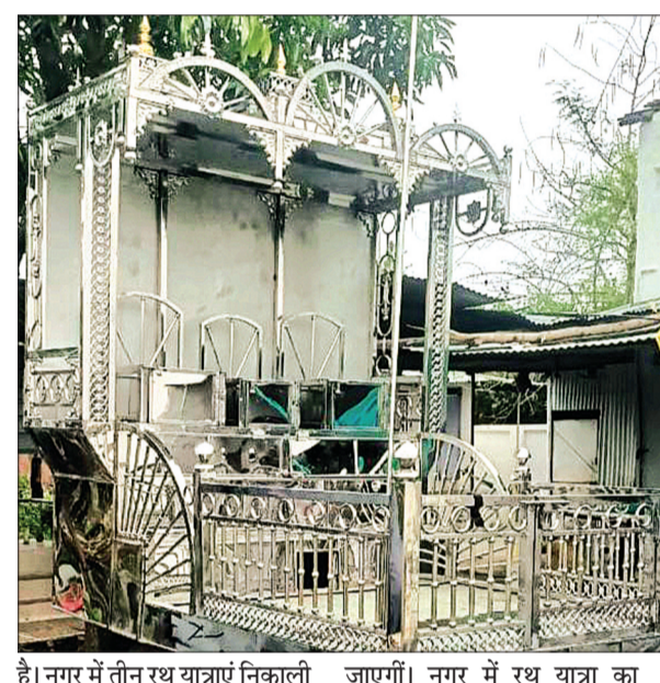
है। नगर में तीन रथ यात्राएं निकाली जाएंगी। नगर में रथ यात्रा का

वेत्रवती घाट स्थित नौलखी धाम पर विराजमान महाप्रभु जगन्नाथ भगवान इस बार रथ यात्रा के मौके पर स्टील से बने नए रथ पर सवार होकर नगर भ्रमण के लिए निकलेंगे। रथ यात्रा के दौरान पुराने रथ की ऊंचाई कम होने के कारण श्रद्धालुओं को महाप्रभु के दर्शन नहीं हो पाते थे, इसलिए स्टील का बड़ा रथ तैयार कराया गया है जिससे श्रद्धालुओं को यात्रा में आसानी से बलभद्र और बहन सुभद्रा और महाप्रभु जगन्नाथ के दर्शन पूरे समय हो सकें। भक्तों के सहयोग से स्टील के रथ को नगर में ही तैयार कराया गया है। जगदीश रथ यात्रा की तारीख नजदीक आते ही तैयारियां जोर-शोर से चल रही